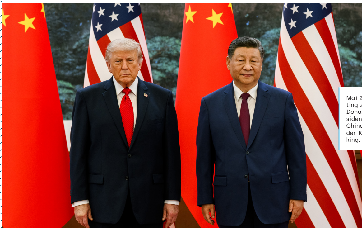
Mai 2026: Bilaterales Meeting zwischen US-Präsident Donald Trump und dem Präsidenten der Volksrepublik China und Generalsekretär der KPCh Xi Jinping in Peking.

Hinzu kommt Chinas Versuch, in internationalen Organisationen wie der UNO eigene Leitlinien zu etablieren. Besonders auffällig ist das chinesische Verständnis von Multilateralismus: Während in Europa universelle Regeln im Zentrum stehen, versteht China darunter die Summe vieler bilateraler Abkommen. Das führt zu grundlegenden Verständniskonflikten.